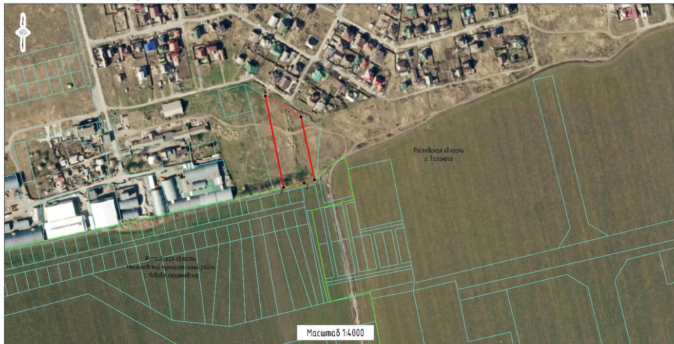
Схема границ территории проектирования проекта планировки и проекта межевания территории для размещения линейного объекта местного значения: «Автомобильная дорога от улицы Паустовского до границы города, в городе Таганроге, Ростовской области»